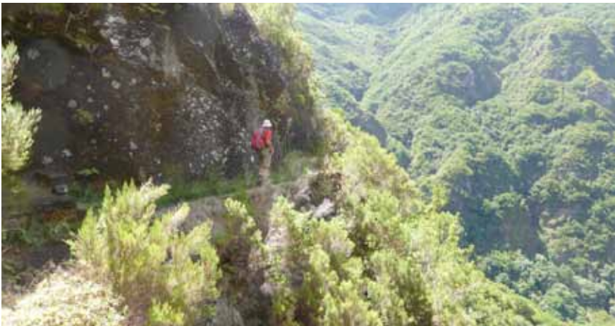
Wolfgang Böttner unterwegs auf Madeira

Wolfgang Böttner berichtet mit Bildern von seinen Wegen auf der Insel am Donnerstag, den 19.11.2015, um 14:30 Uhr im Poppenrichter Seniorenkreis im dortigen Gemeindehaus. Gäste sind natürlich immer herzlich willkommen. Im Anschluß gibt es ein gemütliches Kaffeetrinken.